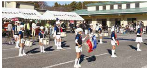
ふれあいまつりの様子