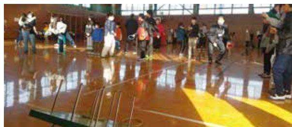
輪投げ大会の様子