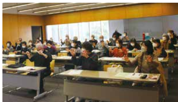
在宅介護支援センターによる健康づくり運動体験