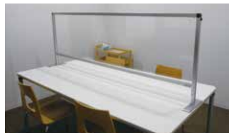
いきいきプラザ1階 共用相談室 看板が目印です

毎月第2・第4水曜日（祝日、2月の第4水曜日は除く） 午前9時～12時 ※2月のみ会場の都合により第3水曜日となります。