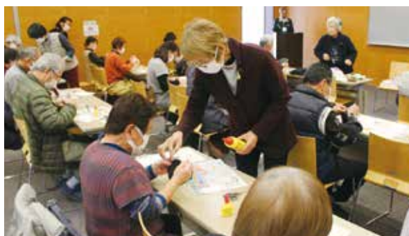
楽らく隊による創作体験

本会でも引き続き、サロンの運営支援とともに、ミニサロン新規設立のサポートを行ってまいります。関心のある方は、お気軽に本会までお問い合わせください。