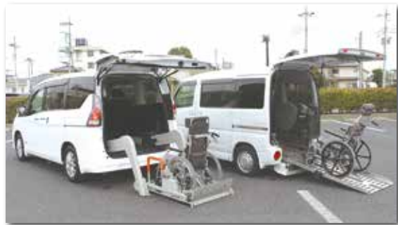
福祉車両の貸出し