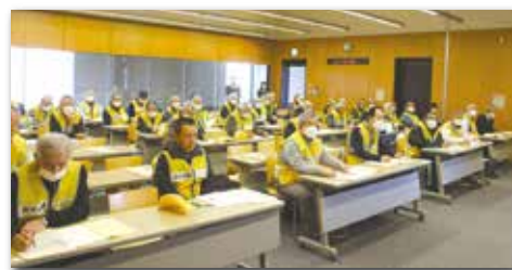
地域の安全見守り隊